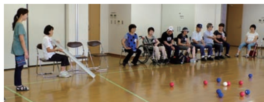
「雨ドイ」を使つてのボール投げも

リオパラリンピックには5人が参加しています。皆さんも来年の地域の大会に是非、参加をして下さい。目標があるとまた、別の楽しみが出て来ます。期待しています。