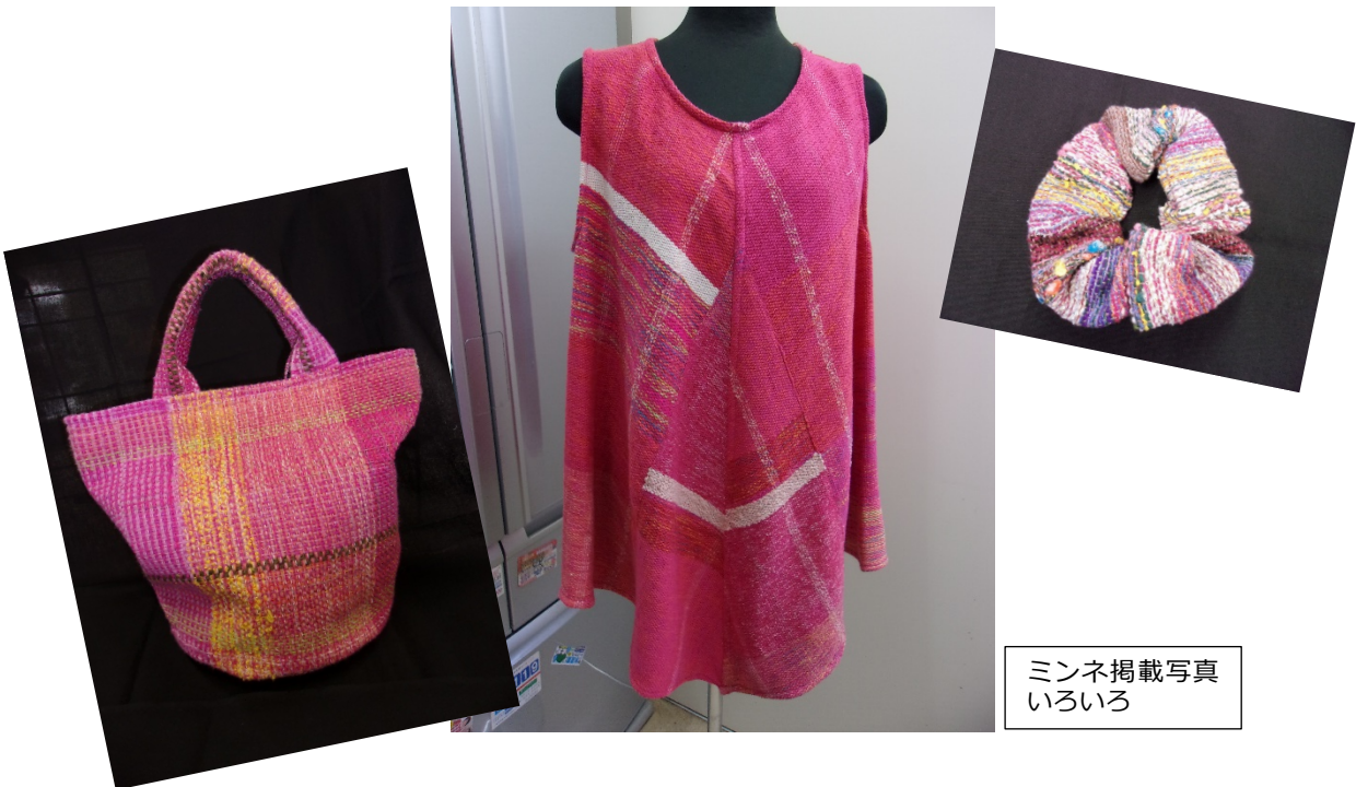
ミネ掲載写真 いろいろ