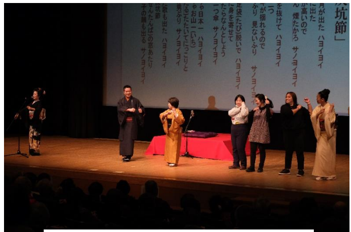
お客様といっしょに「炭坑節」の踊り