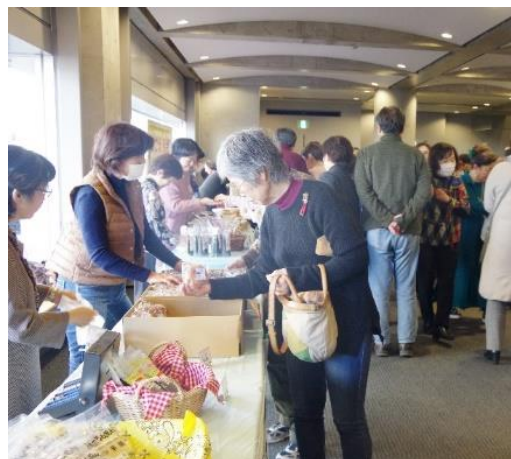
新施設建設のためのドーナツ、ラーメン、ふりかけなどが大好評!!

主に今年度、新施設建設のために行ってきた様々なとりくみとその成果をパネルにして報告しました。引き続きみなさまのご支援よろしくお願ひします。