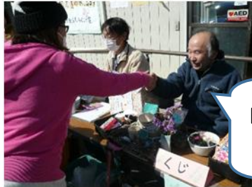
「あたり」です!! 景品をどうぞ!