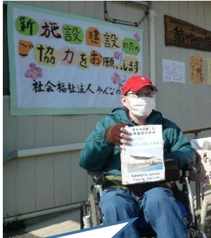
募金にご協力お願いします