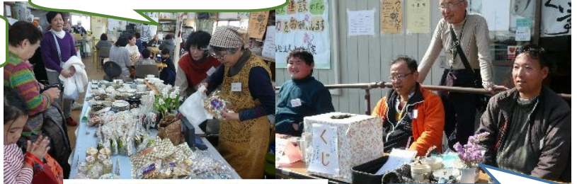
販売コーナーも大忙し!