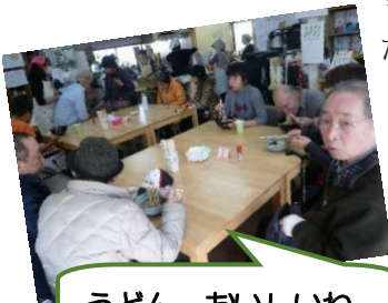
うどん おいしいね

前日から、また朝早くからお手伝いくださったボランティアのみなさん、足を運んでくださったお客様、多くの方に支えられての大成となりました。本当にありがとうございました。