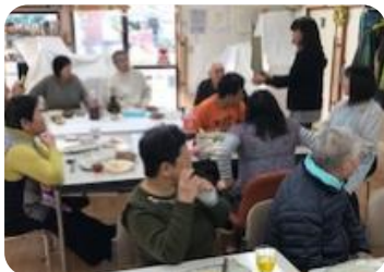
それぞれの写真の主に、 その当時のことを説明し てもらい、その時代を懐 かしみました