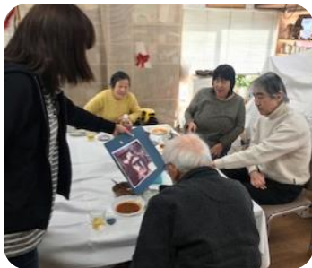
みんなの若いころの写真を 持ち寄って、誰の若いときか 当てるゲームをしました