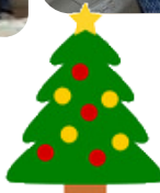
日頃お世話になって いるボランティアさん へ自主製品をプレゼ ントしました☆