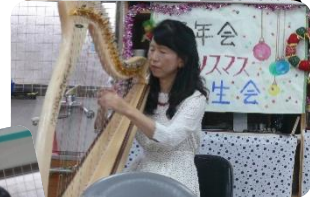
ハーブとフルートの ミニコンサート♪ 素敵な時間を すごしました