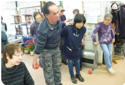
ポッチャ大会で 盛り上がりました！