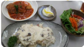
美味しい！洋食ランチ