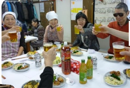
一年お疲れさまでした～！