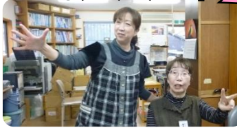
賞品がかかると燃えます！