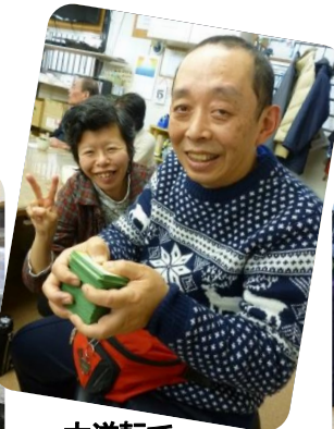
大逆転で ひとり勝ち〜！