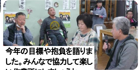
今年の目標や抱負を語りま した。みんなで協力して楽し い作業所にしましょうね。