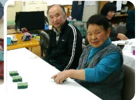
恒例の「坊主めぐり」は いつも真剣勝負！？