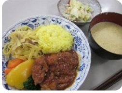
おしゃれな洋食ランチ