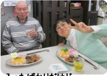
入ったばかりだけど 新年会楽しいです！