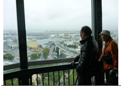
マリインタワーからの眺めは最高！