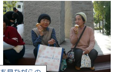
スカイツリーを見ながらの ソフトクリームは格別！