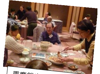
重慶飯店で本格四川料理 をおなかいっぱい食べ ました！