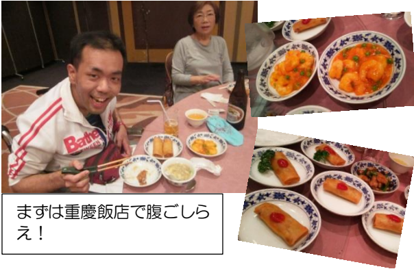
まずは重慶飯店で腹ごしらえ!

初めての日帰り研修旅行 みんなの家では、毎年秋に一泊研修旅行を実施していましたが、今年初めて日帰り旅行を試してみました。 行き先は次の通りです。(日付順) 第三みんなの家 十月六日(金) 江の島方面 第二みんなの家 十月二十日(金) 横浜方面 第一みんなの家 十月二十七日(金) スカイツリー