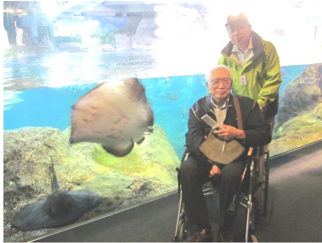
江の島水族館で、エヤと一緒に 第二みんなの家

2017・11・22 編集 社会福祉法人みんなの会 東大和市奈良橋6-728-2