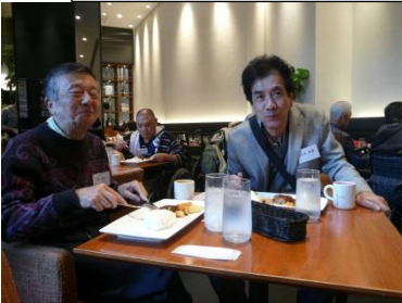
昼食はハンバーグランチ