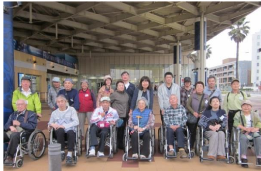
新江の島水族館の前で記念撮影。