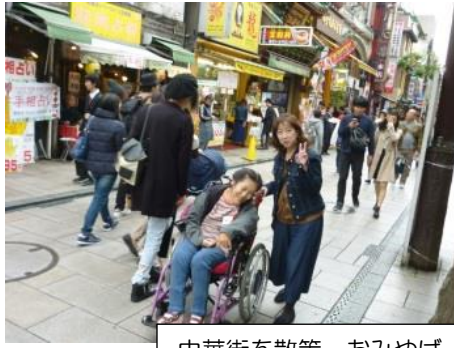
中華街を散策。おみやげ 一番人気は、フタまん！