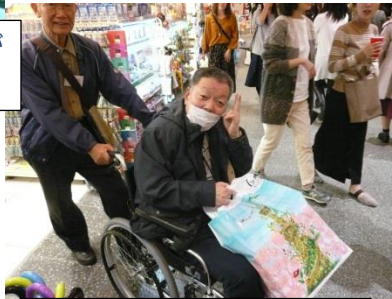
お土産たくさん買いました。