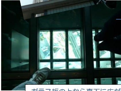
ガラス板の上から真下に広がる 迫力ある眺め