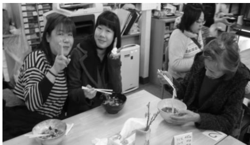
手打ちうどん最高♪