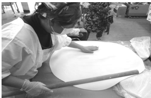
今年は風が強かったけど、みんなを外で受付♪