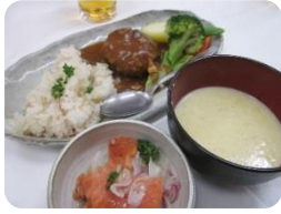
おいしい食事を 楽しみました