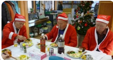
サンタだって腹が減っては・・・なのよ！