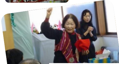
みごとなマジックを披露して くれた南街マジッククラブ のみなさん