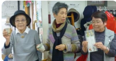
お世話になっているクラブの先生方 に作品をプレゼント～！