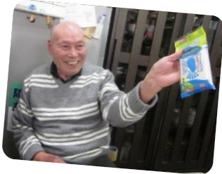
ビンゴ大会で 当たりました！