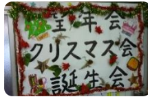
みんなの家で は「のぞむ」 と書くのです！