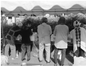
▲みんなで、やきとりの肉を焼きやすいように整えているところです! そんなひと手間がおいしさの秘訣!