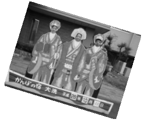
たくさんの作品を見て制作意欲が沸いた笠間陶芸の丘で。