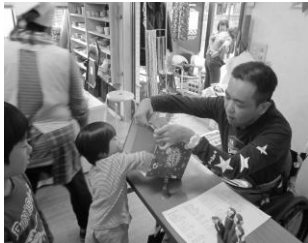
▼なにが当たるかな?

う曲目で楽しませていただきました。模擬店では一本百二十円のやきとりが順調に売れ、おだんごは初めてみたらし団子に挑戦。おいしいと好評でした。喫茶コーナーでは炊き込みごはんややきそばのほか蒸しパンも好評で完売しました。