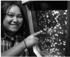
小さなクラゲ、 かわいい!!