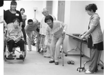
うまく投げられるかな～!? (交流会・ポッチャ大会)