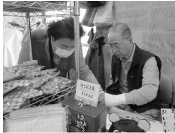
▲全部でいくらかな?

◀ 1本120円のやきとりと、1本80円のおだんご。どちらも本数が増えると計算がたいへん!