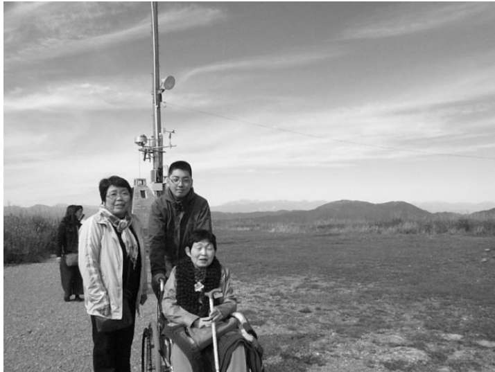
霧ヶ峰のすばらしい眺め！ 第「みんなの家」

2016・11・08 編集 社会福祉法人みんなの会 東大和市奈良橋6-728-2