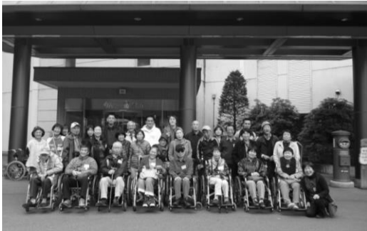
初めて泊まったけど、料理もお風呂も最高でした～!(かんぼの宿 諏訪)