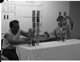
交流会の缶積みゲーム。 チーム対抗で盛り上がった。