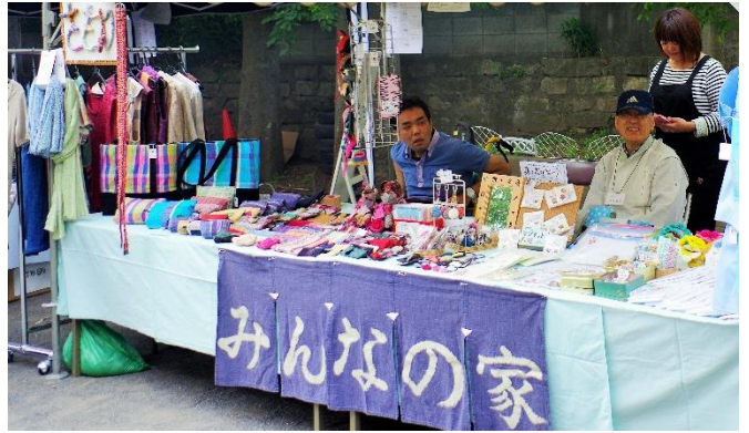
第23回 みんなの家まつり「作品市」の様子