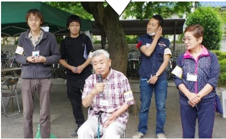
実行委員長より開会のあいさつ