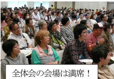
全体会の会場は満席!