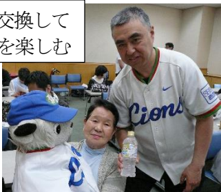
名刺交換して交流を楽しむ