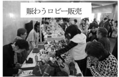
賑わうロビー販売

自主製品なども、多くのお客様に買っていただき、貴重な工賃収入となりました。 さをり織りのテディベアが仲間入り