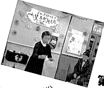
実行委員が扮したサンタから素敵なプレゼントを買って皆笑顔。