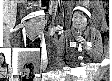
実行委員はサンタさんにハンシ〜ン!