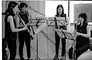
国立音大生によるクラリネット四重奏♪