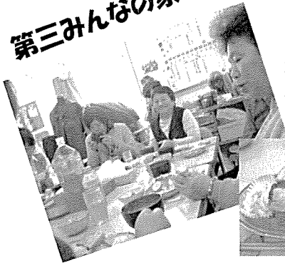
おいしい食事でカンパ〜イ!