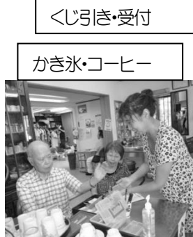
かき氷・コーヒー