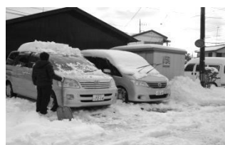
雪にうもれた 第二みんなの家

まずは、搬入口や駐車場の雪かきから始ま りました。予定していた搬入口も雪にうも れて全く使えず地下から人海戦術で運び上 げました。あまりの悪路に運転ボランティア アさんには大変な負担になるため、送迎は 急遽介助も入つての二人体制に。その間も ホール周辺の歩道やエントランスでは、ボ ランティアアさん、実行委員、理事長たちの 汗びっしょりになっての雪かきが続いて、 ようやく安全にお客様が歩ける状態になり ました。早朝、悪天候を心配して飛び入り