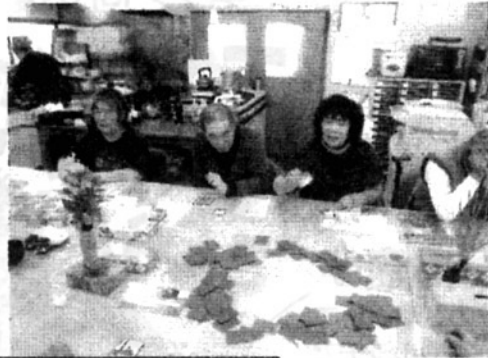
カルタを楽しんだ新年会