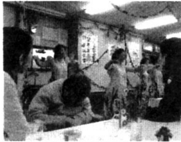
ラウナ・レアの皆さんの華やかなフラダンス