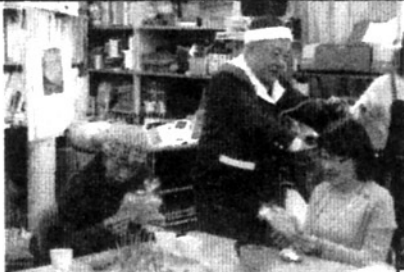
サンタに扮した実行委員さんからのプレゼント