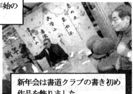
新年会は書道クラブの書き初め作品を飾りました