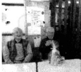
「ぼうずめぐり」の豪華賞品頂きました