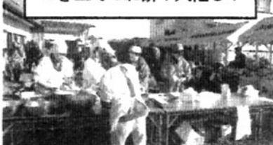
つき立てのお餅! 大忙し!