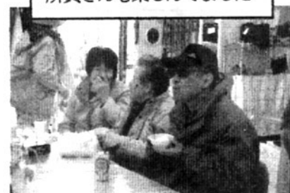
所員さんも楽しんでました