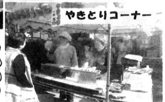
やきとりコーナー